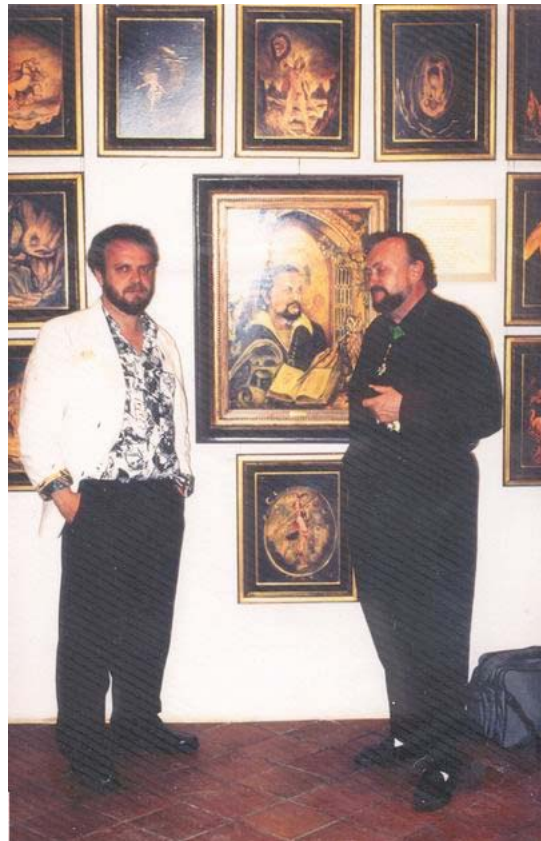
Tentoonstelling van de tarotkaarten en het befaamd schilderij in Dampierre.

vond zijn vorig leven (bij toeval?) in Frankrijk terug.